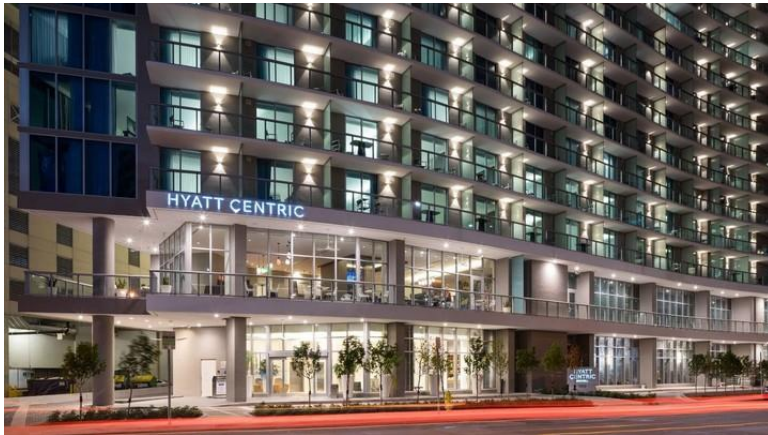
Hyatt Centric Brickell Miami

"Pero este último año empezó a incrementarse, otra vez, el interés por invertir en Miami. Las expectativas sobre la economía argentina son menos favorables. Por lo tanto, está comenzando a ver un incremento de capitales que benefició al mercado inmobiliario de la Florida".